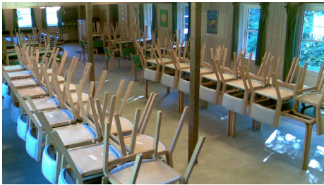
Bordopstilling når hytten forlades. Hvide stole ved de to langborde. Grønne stole ved hvert af de 4 gruppeborde.